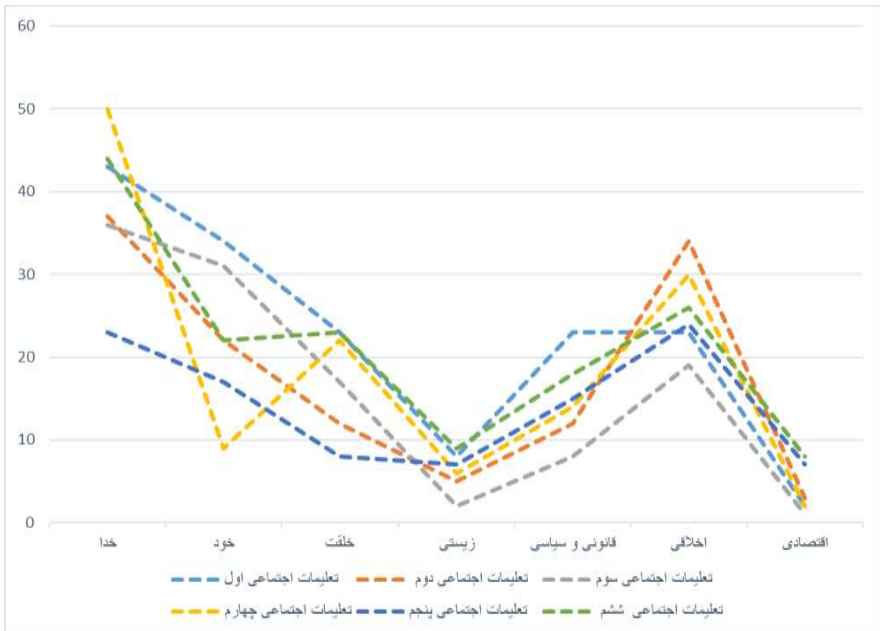
نمودار ۲: مقایسه کتب درسی تعلیمات اجتماعی ابتدایی با هم، در میزان توجه به مسئولیت پذیری اسلامی

نمودار ۲ نیز به خوبی نشان می‌دهد که به زیرمؤلفه‌های مسئولیت‌پذیری اسلامی نگاهی متعادل نشده است اما در این میان تعلیمات اجتماعی دوره اول (اول، دوم و سوم) بهتر از تعلیمات اجتماعی دوره دوم (چهارم، پنجم و ششم) عمل کرده است.