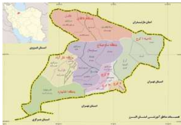
شکل ۱- موقعیت جغرافیایی مناطق آموزش و پرورش استان

در این تحقیق، با توجه به گستردگی جامعه آماری و میسر نبودن اجرای تحقیق بر روی کل جامعه، از روش نمونه گیری تلفیقی شامل نمونه گیری تصادفی خوشه ای و ساده استفاده شده است. برای این منظور ابتدا نواحی و مناطق به چهار قسمت جغرافیایی تقسیم شدند و سپس از بین آن ها، تعداد دو منطقه شرقی و شمالی که شامل (مدارس و ادارات ناحیه یک کرج، منطقه طالقان و اداره کل آموزش و پرورش استان البرز به صورت تصادفی انتخاب شدند.