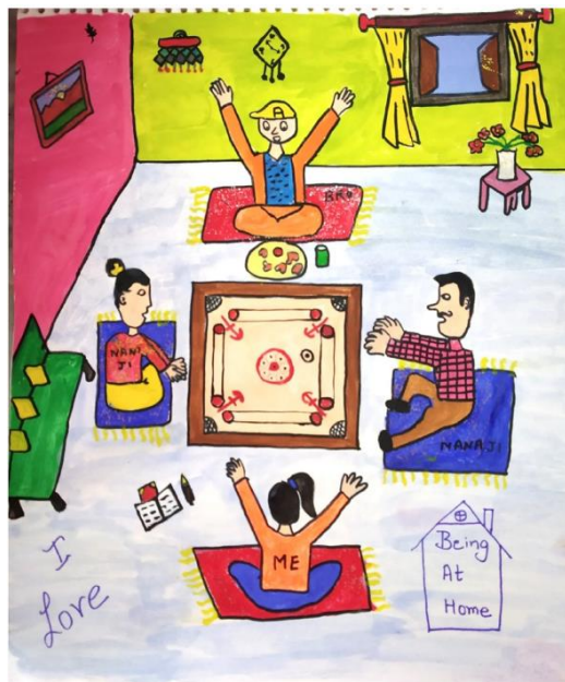
شکل ۱. نقاشی نشان دهنده تجربیات شاد یک کودک ۱۱ ساله در طول قرنطینه.

چگونگی شکستن زنجیره ویروس، ایده قوی بودن و مبارزه با همه گیری با هم و دیدگاه های بی شمار از تفکر و احساس؛ درک این ذهن های گرانبها در طول قرنطینه یک تجربه غنی بوده است. چنین اقداماتی را می توان برای کاهش بار روانی بر کودکان و خانواده های آنها و محدود کردن عفونت گسترش داد. از این رو، چنین اقداماتی می تواند برای رسیدگی به یک بحران بهداشت عمومی مشابه در آینده نیز مورد استفاده قرار گیرد.