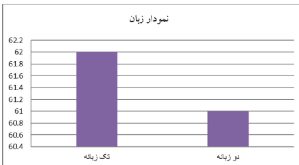
نمودار ۱: توزیع درصد فراوانی مربوط به وضعیت زبان پاسخ دهندگان

مطابق جدول و نمودار مشاهده می شود ۶۲ نفر معادل (۵۰/۴) نفر از پاسخ دهندگان تک زبانه و ۶۱ نفر معادل (۴۹/۶) از پاسخ دهندگان دوزبانه هستند.