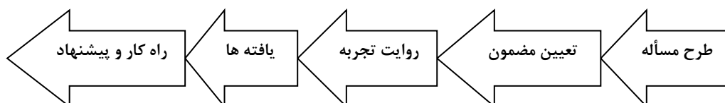
شکل ۱: روش کلی گردآوری تجارب آموزشی

ابزار گردآوری اطلاعات، می تواند کاربرگ، یادداشت، خاطره نویسی، فیلم، عکس و... باشد.